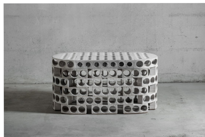
TABLE — TABOURET / STOOL — COFFEE TABLE